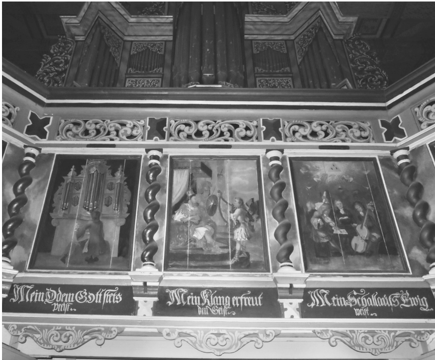
Abbildung 5: Golzwarden (Wesermarsch), Brüstung der Westempore. Johann Christoph Wallzell, 1701

den direkten irdischen Nutzen der Musik und werden durch die Darstellung des Königs David vor Saul visualisiert. Mit den Worten »Mein Schall aufs Ewig weist« wird schließlich eine vokal-instrumentale Kammermusikszene kommentiert, über der ein himmlisches Musizieren zu sehen ist. Folglich sind in jedem der Bilder Professionelle dargestellt; doch mit dem Possessivpronomen der 1. Person wird klar, dass mit diesem musikalischen Imperativ in der Glaubensübung jeder Betrachter gemeint ist – jeder, der unter diesen Bildern allsonntäglich aus der Kirche herausgeht.