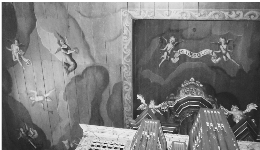
Abbildung 2: Møgeltønder (Südwestdänemark), Detail: Orgel von 1679 und Himmelsbild 1740